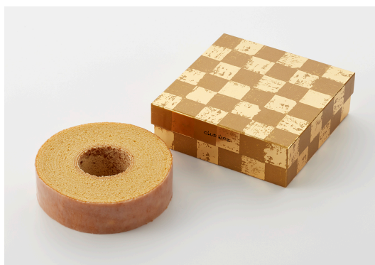
バームクーヘン KOGANE 税込 1,674 円