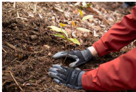
植樹する苗木はどんぐりから育てています