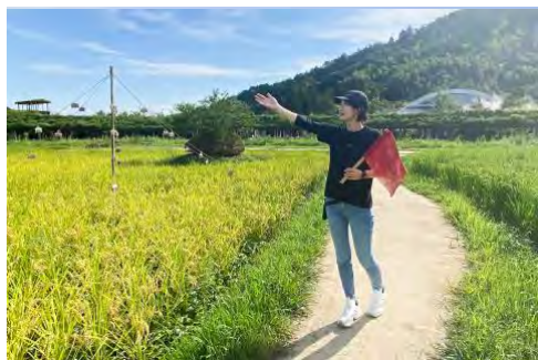
ラ コリーナツアーイメージ

50 年、100 年後ふるさとの山につながる森を目指し、たねや・クラブハリエでは 2009 年よりどんぐりから育てた苗木を植える“どんぐりプロジェクト”を続けてきました。「体験ツアー 森づくり」ではこうした取り組みや自然のなかで木が果たす役割、繊細な生態系のつながりについてスタッフが紹介しながら、植樹を体験いただけます。ラ コリーナ近江八幡の森づくりにご参加いただくとともに、身近な自然や景色の見方が変化するきっかけとなることを願ったツアーです。