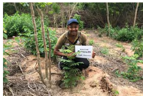
マダガスカル北部モンターニュ・デ・フランセでの植樹の様子▶