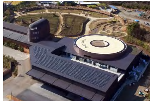
バームファクトリー屋上の太陽光パネル

2023 年 1 月にオープンした新店舗バームファクトリーの屋上には太陽光パネルを設置し、発電を行っています。太陽光による発電量はラ コリーナ近江八幡で使用する電力の約 1/8 に相当し、不足分の電力については関西電力の「再エネ ECO プラン」により再生可能エネルギーに切り替えました。今後は滋賀県内の店舗や工場でも同様の切り替えを進め、たねや・クラブハリエ全体で 2030 年の電力カーボンニュートラル実現を目指します。